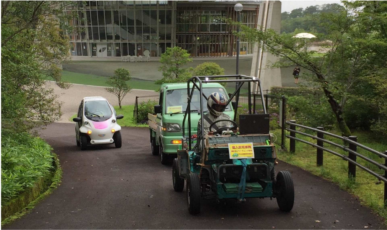
テスト走行中の「ビレッジ・モビリティ」(手前)

前回の記事 で紹介した開発進行中の超小型モビリティ、「ビレッジ・モビリティ」のテスト走行が開始されました。豊田市の協力により、矢並町の鞍ヶ池公園にある「旧ドライブコース」を借り受けて実施しています。